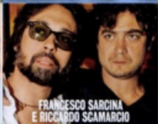
FRANCESCO SARCINA E RICCARDO SCAMARCIO